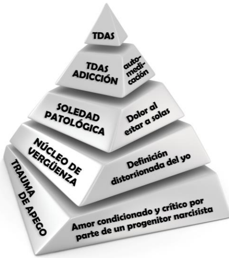
PIRÁMIDE DEL DÉFICIT DE AMOR A SÍ MISMO TDAS