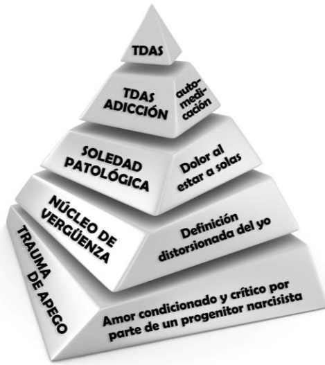
PIRÁMIDE DEL DÉFICIT DE AMOR A SÍ MISMO TDAS