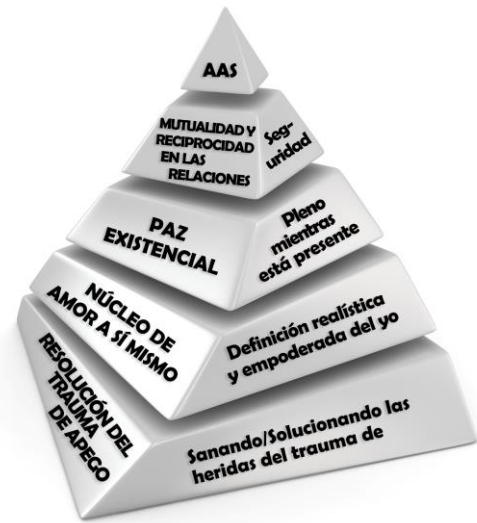
PIRÁMIDE DE LA ABUNDANCIA DE AMOR A SÍ MISMO